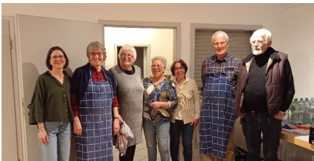
Das Koch Team / les cuiseniers

Dazu wurde, je nach persönlicher Vorliebe, Rotwein und Rosé der Winzerfamilie Perrin aus Südfrankreich gereicht, sowie Mineralwasser. Es war ein sehr angenehmer Abend mit vielen interessanten Gesprächen.